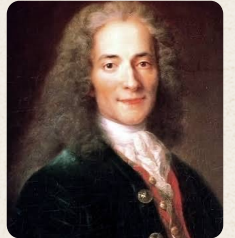
Portrait de Voltaire

Vous êtes-vous déjà demandé d'où venait le nom de notre école ? Et bien, dans cet article, nous allons vous répondre. Voltaire s'appelle en réalité François-Marie Arouet. Il naît le 21 novembre 1694 à Paris et meurt le 30 mai 1778 à l'âge de 83 ans. Il est un écrivain et philosophe français. Il a par ailleurs écrit des livres de : contes, théâtre, poésies, histoires, pamphlets, et contes philosophiques.