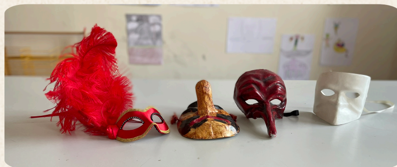
Des masques de Carnaval issus de différents pays

Au Moyen-Âge, l'Église catholique reprend petit à petit des fêtes anciennes (paiennes) et les transforme pour qu'elles correspondent aux fêtes chrétiennes. Ainsi, le Carnaval commence à l'Épiphanie (c'est-à-dire le 6 Janvier), et se termine le jour de Mardi Gras, qui a toujours lieu 41 jours avant Pâques.