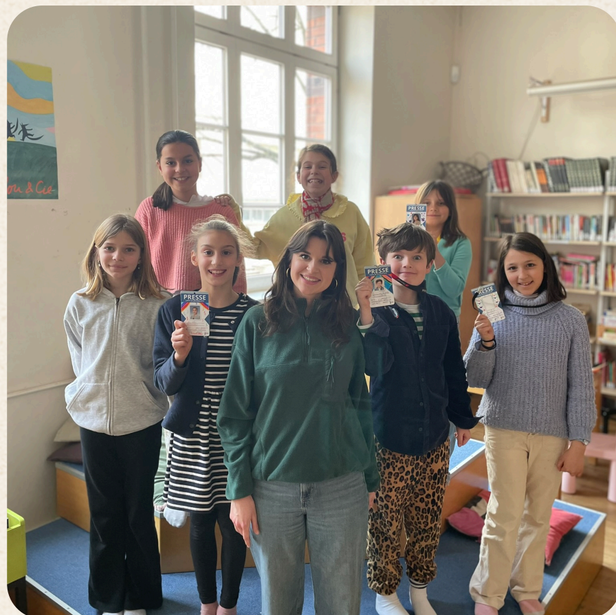
Photo de groupe de la rédaction

Découvrez l'un des visages qui se cache derrière le projet AVEC UNE INTERVIEW EXCLUSIVE DE LA VENDEUSE DU GRENIER À BULLES !